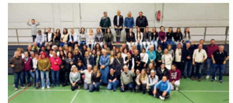
Freude an der Gemeinschaft: ein Hoch auf 50 Jahre Mädchen- und Frauenhandball!

TVA brachte ihre Aufbruchstimmung wunderbar mit ein.