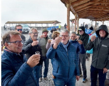
Gipfelschnaps auf der Passhöhe des Patapampa-Passes (4.910 m hoch)

geistert zurück. Jeweils einen ausführlichen Gesamtbericht und ein Reisetagebuch mit vielen Fotos finden Sie auf der TVA-Homepage unter Gesamtverein -> Reisen.