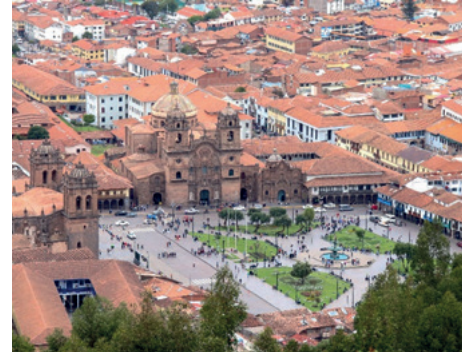
Inkauptstadt Cusco, Plaza de Armas mit Jesuitenkirche