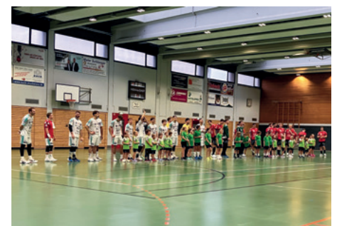
Spitzensport für den guten Zweck, zugleich Deutsch-Schweizer Begegnung in Altbach.