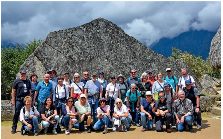
In Machu Picchu